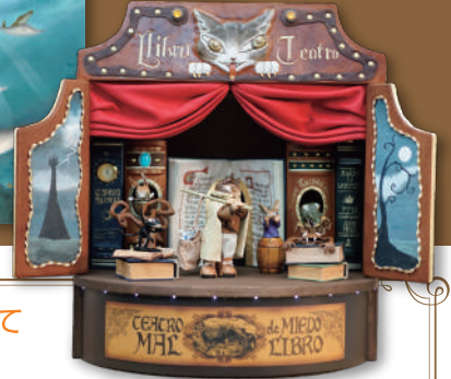
革ジオラマ「こわい本の劇場」/2018年