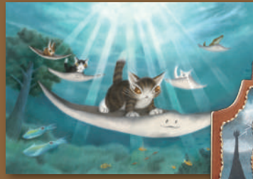
陸イイに乗って/2018年

1976年、革メーカー「わちふいーと」創設。1983年、自由が丘本店のシンボルマークとしてダヤンを描く。1987年より、「猫のダヤンとわちふいーとの世界」をモチーフに多くの絵本や長編物語を創作、旅をイラストとエッセイでつづったスケッチ紀行シリーズや教科書の挿絵を手掛けるなど、幅広く活躍。