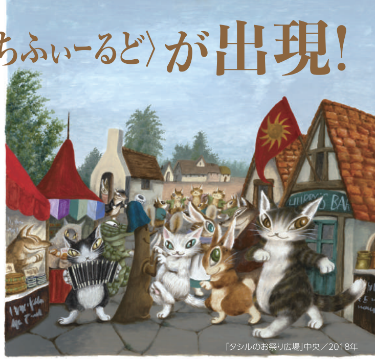
「タシルのお祭り広場」中央/2018年